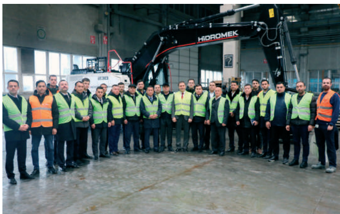
委員会: ウズベキスタン・国名: Türkiye・日付: 2024年12月20日