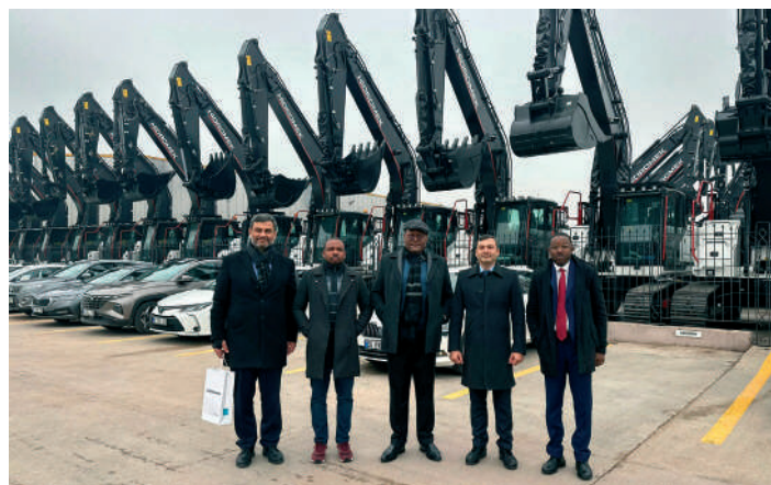
委員会: カメルーン大使・国名: Türkiye・日付: 2024年12月6日